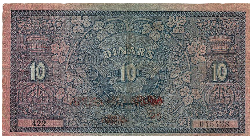
Novčanica od 10 dinara - 40 kruna Ministarstva financija Kraljevstva SHS, izdanja 1919. godine